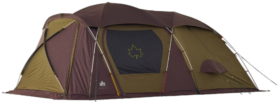
写真1. 該当する商品の一例