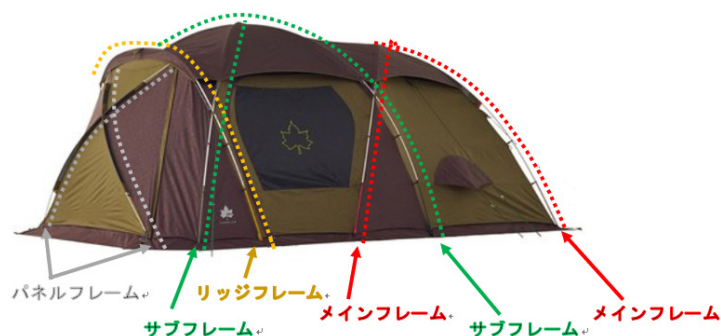
写真2. 当該品の各フレーム位置