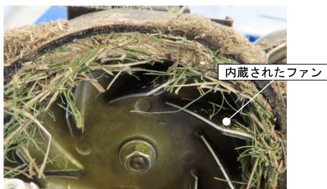
写真. 取扱説明書に従わない使用によりファンに芝が詰まった様子

そこで、10cm以上の長い芝を一度で短く刈り、ボックスに溜まった芝が満量になっても捨てずに芝刈りを続けたところ、当該品及び同型品のいずれも刃の動きが弱まり、その後、停止する様子がみられました。ボックスとその付近に溜まった芝を取り除くと、再び芝刈りを行うことができましたが、これを複数回繰り返すと、芝を取り除いても刃はほとんど動かず、1～2秒ほどでモーター音が停止しました。この当該品及び同型品を分解したところ、いずれも当該品が提供されたときと同様に内部のファンに芝が詰まっており、モーター及び刃の動きに異常が生じていました（写真参照）。