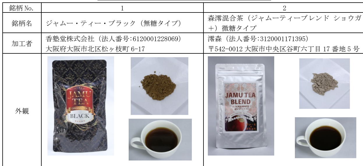
表1. デキサメタゾンが検出された銘柄の外観等

https://www.kokusen.go.jp/news/data/n-20230412_1.html